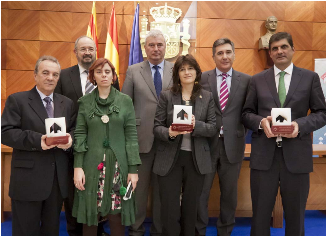
Los representantes de las entidades premiadas, junto a las autoridades y al Presidente de Fundación DFA.