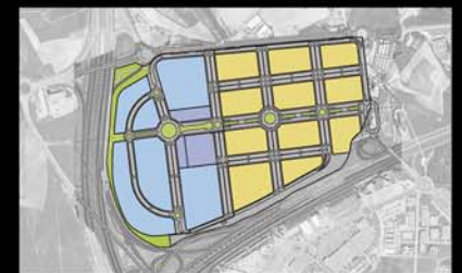
PAU PP-8 "El Lucero" Alcorcón. Madrid