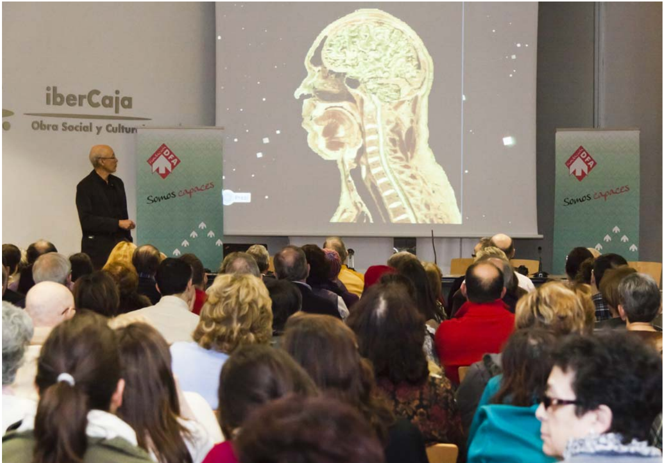
Más de 190 personas asistieron a la conferencia sobre enfermedades neuromusculares en Ibercaja Zentrum.