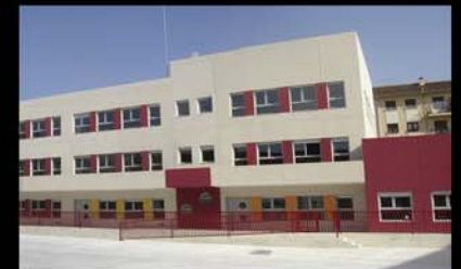
CEIP Rochapea. Pamplona