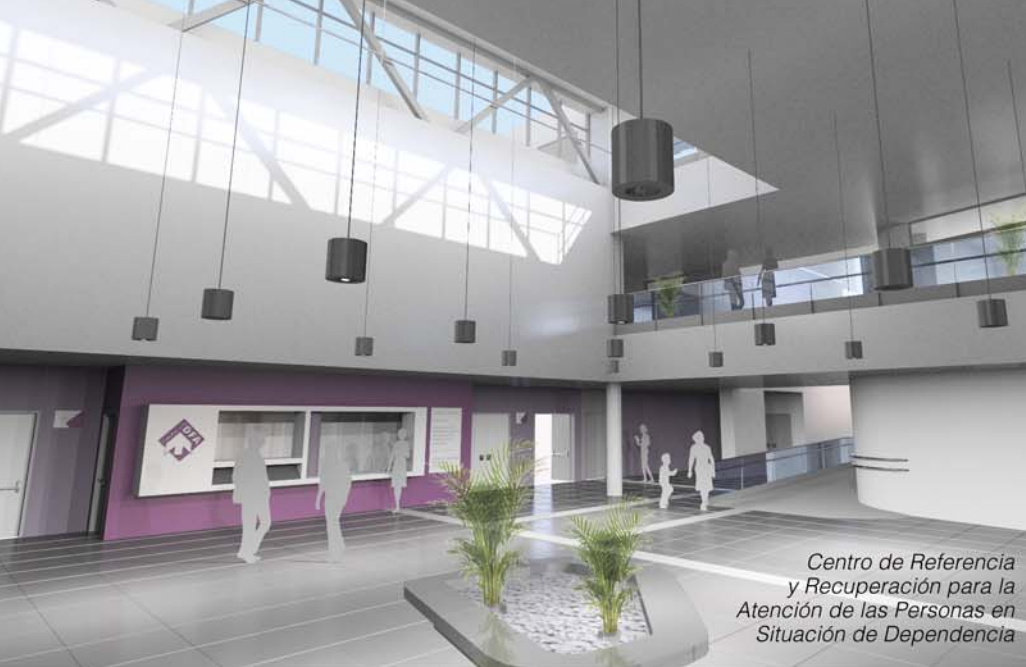
Centro de Referencia y Recuperación para la Atención de las Personas en Situación de Dependencia