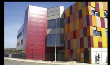
Residencia Gran Discapacidad. León