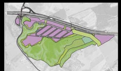
PP Industrial "La Corzana" Monzón. Huesca