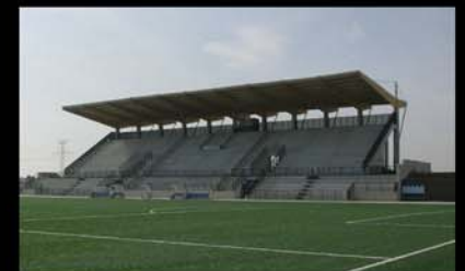
Campo de Fútbol de Cienpuzuelos. Madrid