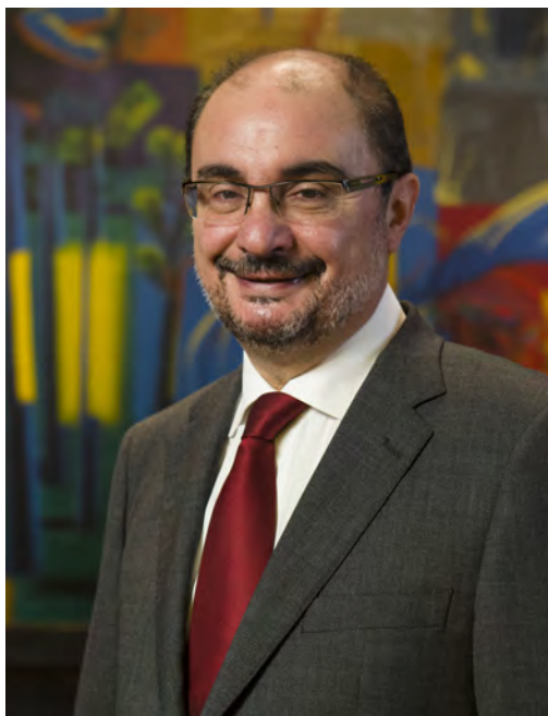
Javier Lambán Montañés